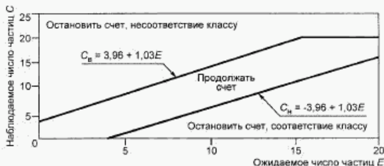
Рисунок F.1 — Границы соответствия и несоответствия классам чистоты при использовании метода последовательного отбора проб

На рисунке F.1 по оси абсцисс отложены значения ожидаемого числа частиц E , если концентрация частиц равна максимально допустимому значению для заданных размеров частиц и класса чистоты (В.4.2). По оси ординат отложены значения наблюдаемого числа частиц C в пробе.